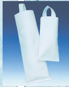
フィルターバッグ (ポリプロピレン)